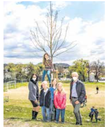
Schul-Beispiel. Über ein Schulbeispiel für gelungene Neupflanzungen von 16 Bäumen freuen sich Kinder, Lehrkräfte und Eltern an der Volksschule St. Veit in Andritz.