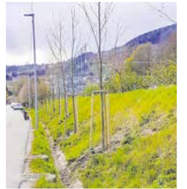
Aprilbaum. In der Salfeldstraße wurden dieser Tage gleich 20 neue Bäume gepflanzt.